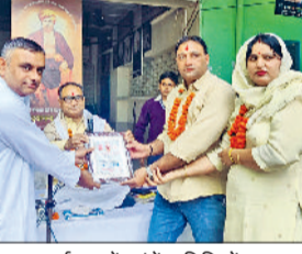
सोनीपत। कार्यक्रम में पहुंचे अतिथियों का स्वागत करते हुए आर्य समाज के पदाधिकारी।