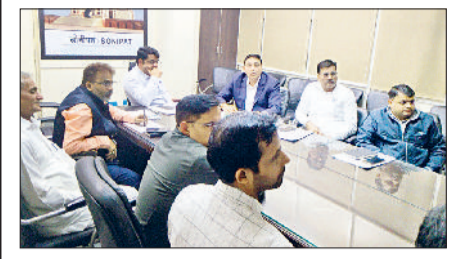
सोनीपत। ऑनलाइन ड्रा के दौरान उपस्थित अधिकारीगण।

सोनीपत। फसल अवशेष से संबंधित कृषि यंत्रों का वीरवार को विभागीय पोर्टल पर ऑनलाइन ड्रां किया गया। जिसमें जिला स्तरीय कार्यकारी कमेटी के द्वारा किसानों का चयन किया गया। जिसमें से सुपर सीडर के 42, बेल्गर मशीन के 16, स्ट्रॉ रैक के 2, रोटरी स्लेशर के 14, लोडर के 13, जीरो टील के 9, सुपर एसएमएस के 5, रीपर बाइंडर के 2, स्मार्ट सीडर के 2, रिक्सिबल एमबी प्लॉ के 4, पैडी स्ट्रॉ चॉपर के 38 व सर्फेस सीडर के 2 शामिल हैं। अब इन सभी के पोर्टल पर दस्तावेज जांचकर इनको ऑनलाइन अप्रुव ल द जाएगी। जिसके बाद किसान कृषि यंत्र को खरीद कर बिल पोर्टल पर अपलोड कर सकते हैं। किसानों को 30 नवम्बर तक कृषि यंत्र खरीदने होंगे और 10 दिसंबर तक बिल पोर्टल पर अपलोड करवाने होंगे। कृषि एवं किसान कल्याण विभाग के उप निदेशक डॉ पवन शर्मा ने जानकारी देते हुए बताया कि फसल अवशेष प्रबंधन संबंधित कृषि यंत्रों के ऑनलाइन आवेदन कृषि विभाग के पोर्टल पर 20 अगस्त तक लिए गए थे। सोनीपत जिले में 1953 किसानों ने पोर्टल पर फसल अवशेष संबंधित कृषि यंत्रों के लिए ऑनलाइन आवेदन किया था। जिसमें से पहले स्तर में 645 का चयन हुआ था। अब शेष आवेदकों में से 149 का चयन किया है।