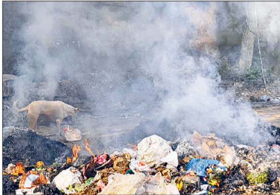
सोनीपत। सब्जी मंडी में जलाए गए कूड़े से उठता हुआ धुआं।

लगतार चार दिनों से 300 से ऊपर एक्वआई नवंबर की शुरुआत से ही जिले में वायु गुणवत्ता सूचकांक लगातार 200 से ऊपर बना हुआ है। सोमवार को यह 345, मंगलवार को 381, और बुधवार को 372 दर्ज किया